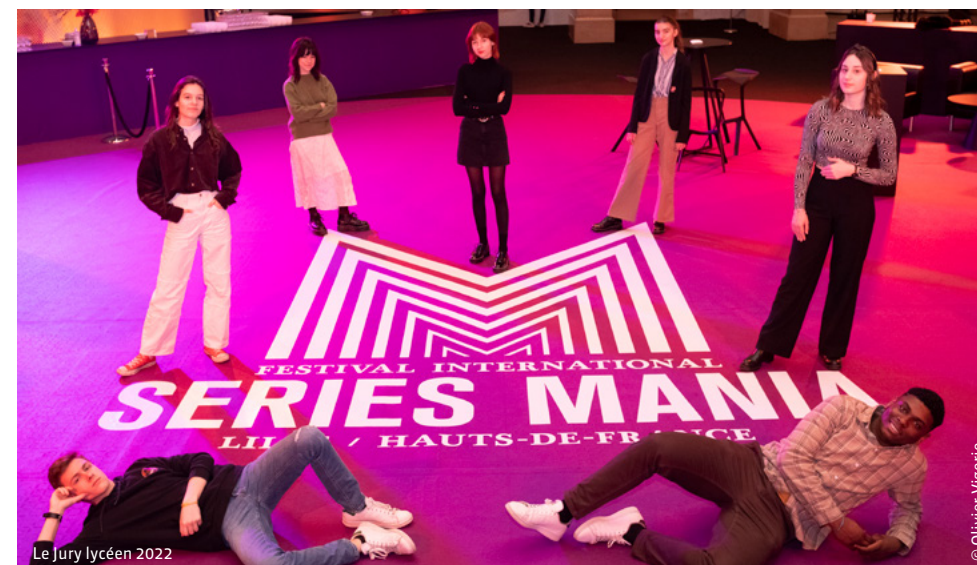
Le Jury lycéen 2022