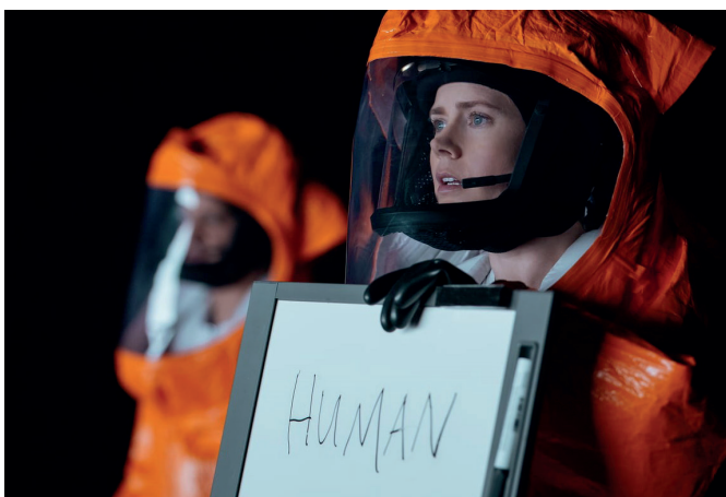
Mommy, Xavier Dolan / Big Little Lies, Jean-Marc Vallée / Premier Contact, Denis Villeneuve