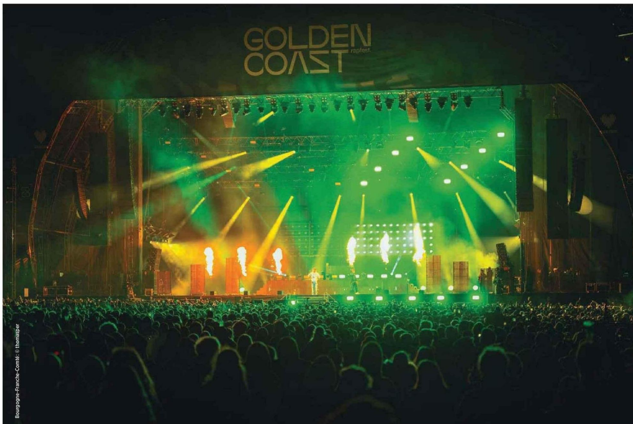
Bourgogne-Franche-Comté © Thomazger